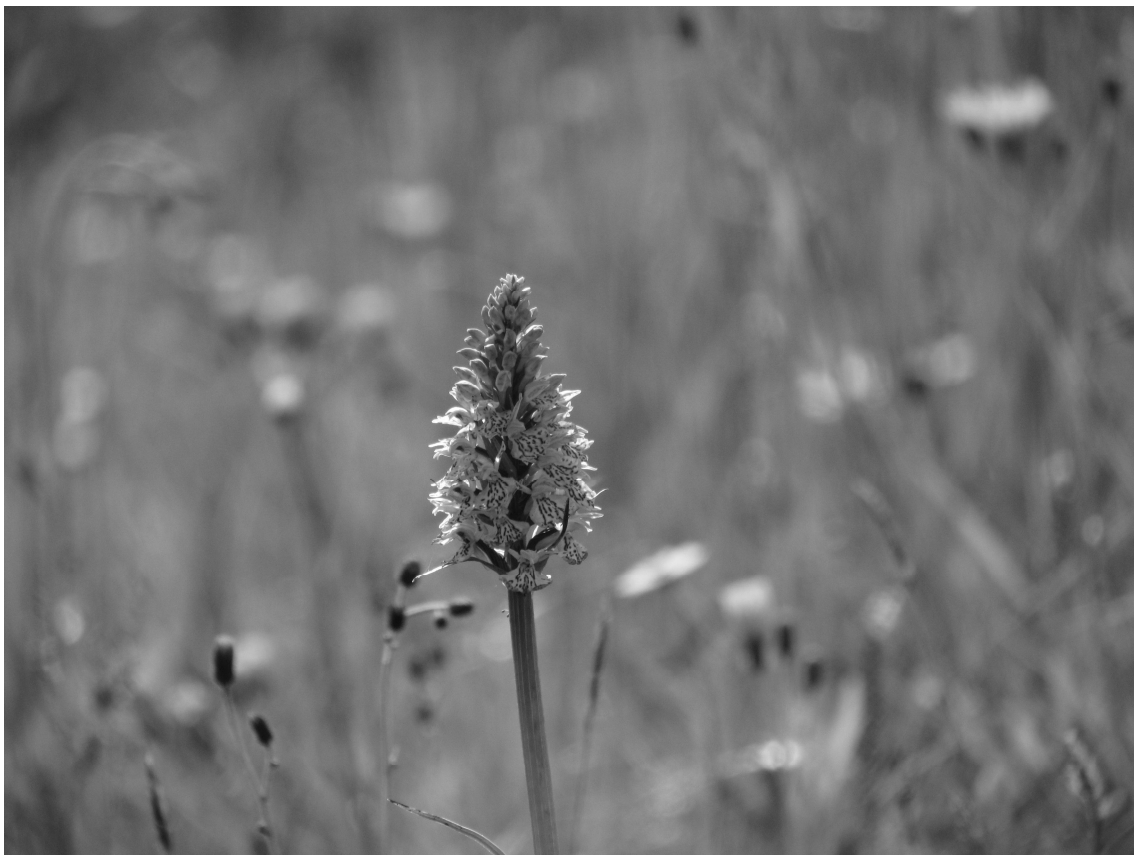
Blomax av Jungfru Marie nycklar