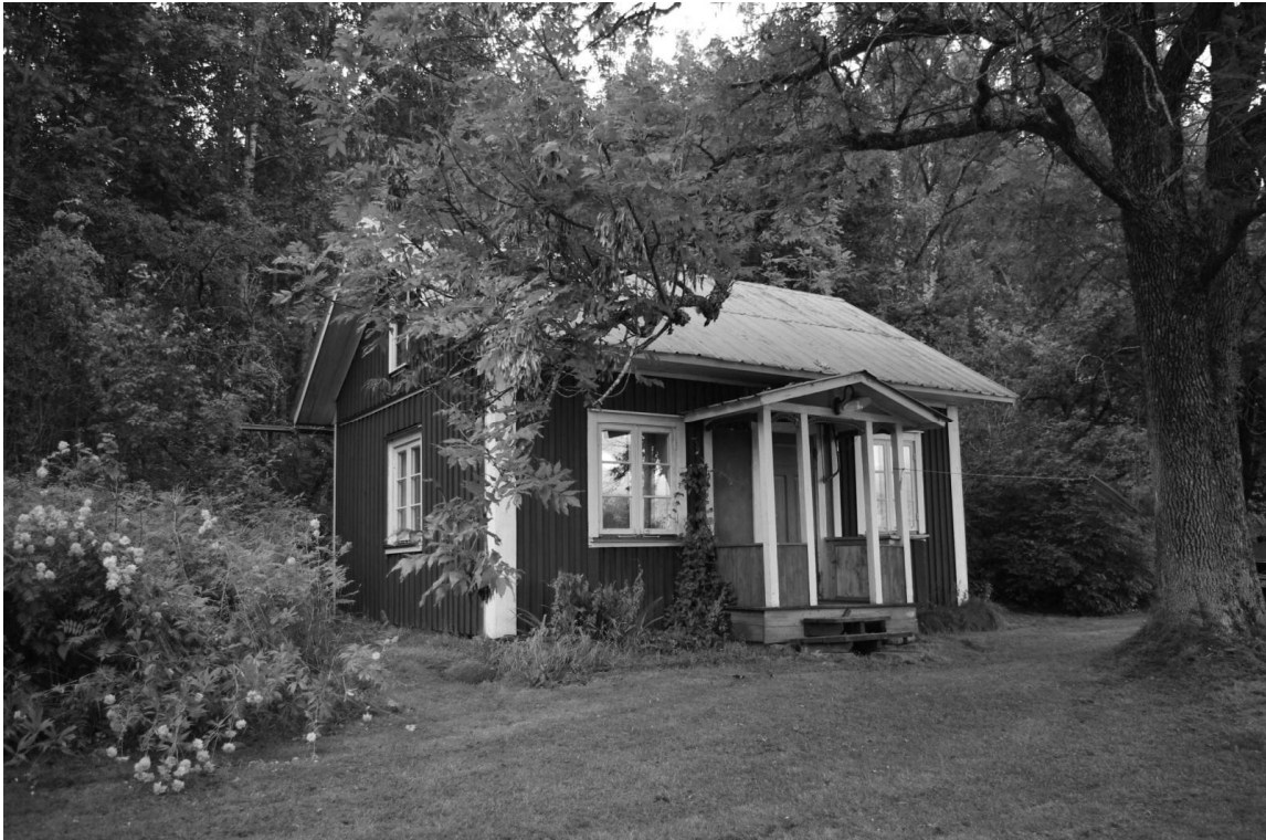
Föreningens fastighet Väststuga i Årtakan

Vill ni bo i vårt fina torp Årtakan gratis? Det får ni om ni klipper gräset eller utför överenskommen syssla. Det ligger några kilometer väster om Sulvik. Ni är alla hjärtligt välkomna att vara med och pyssla vid torpet. Att hyra torpet utan att greja kostar 100 kr per dygn för medlemmar icke medlemmar betalar 150 kr per dygn.