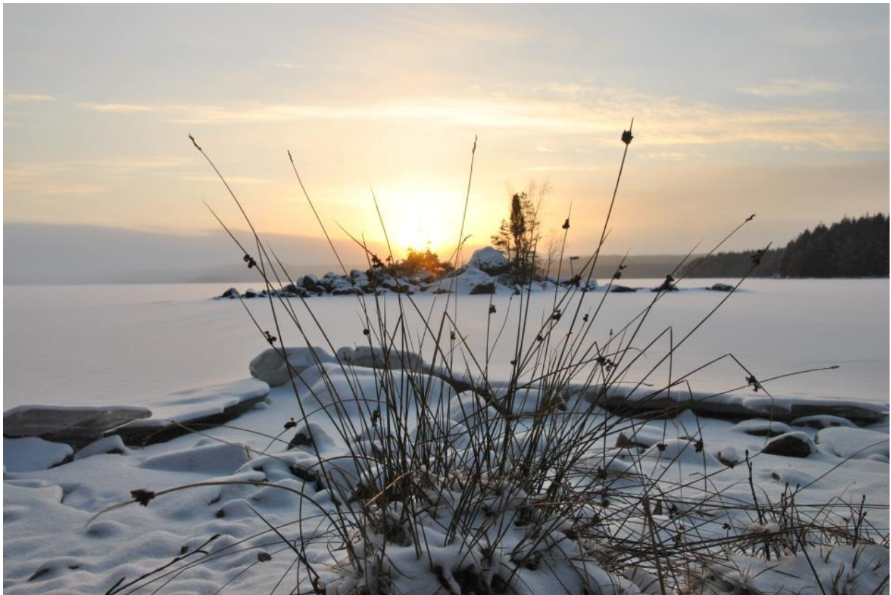
Solnedgång, Övre Gla - Glaskogen

Nu stundar ännu en fin vår. I skrivande stund är det fortfarande snö och is ute men när solen tittar fram och värmer och man hör talgoxens tittitu tittitu är det som att knoppar börjar brista inuti en. Man vill ut för att få uppleva de första vårtecknen!