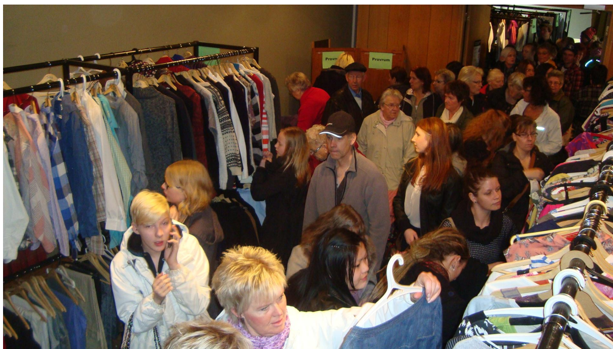
Klädbytardagen på Ritz förra året

Det kommer att finnas experthjälp som hjälper dig att sy om dina plagg, s.k. öredesignö Vi kommer också att ha ekologiskt Café. Se tidsplanen inne i programmet.