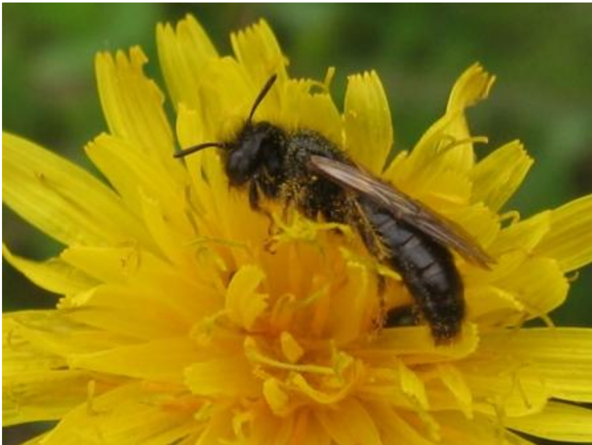
Storfibblebi (rödlistad, NT) på blomkorgen av gråfibbla.

Kontaktperson (information/samåkning): Per Larsson, 073 – 73 18 493