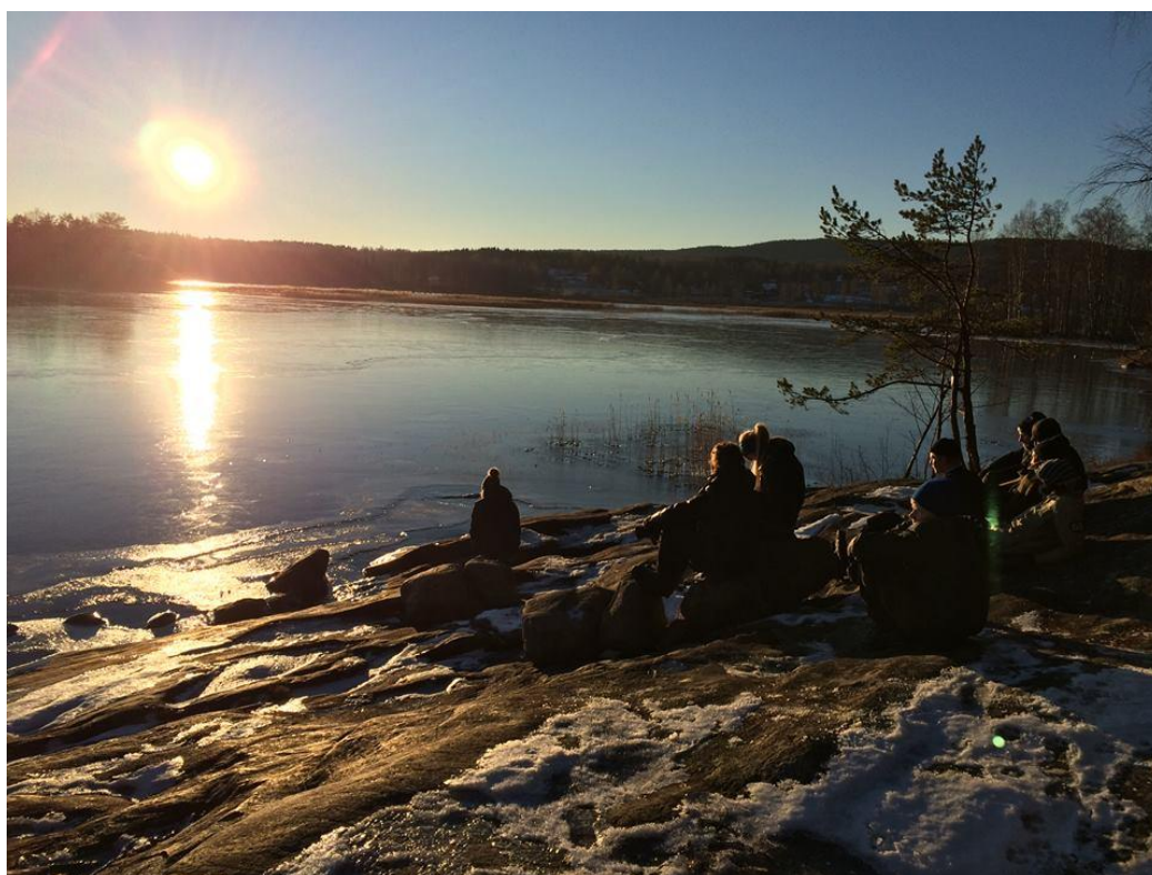
Bergs Klätt

Årsmöte Tors 26 mars. Ska torpet i Årtakan säljas?