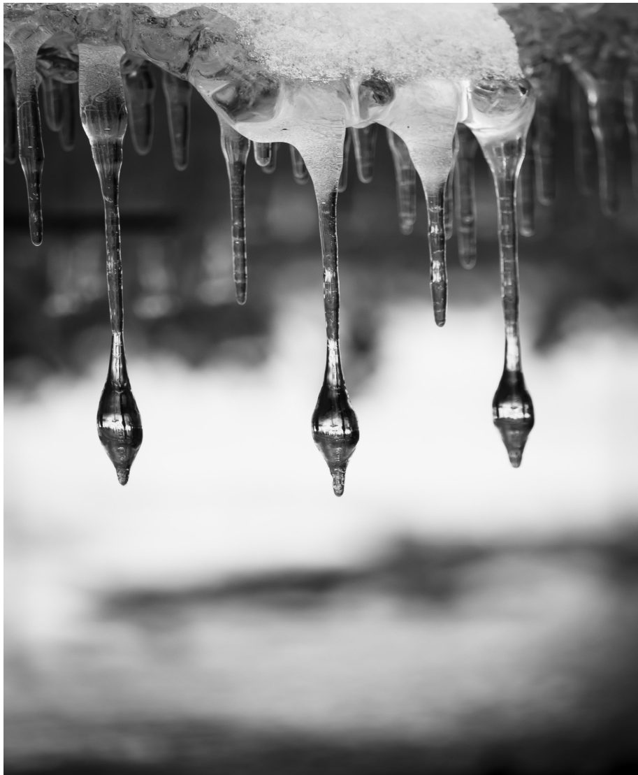
Istappar