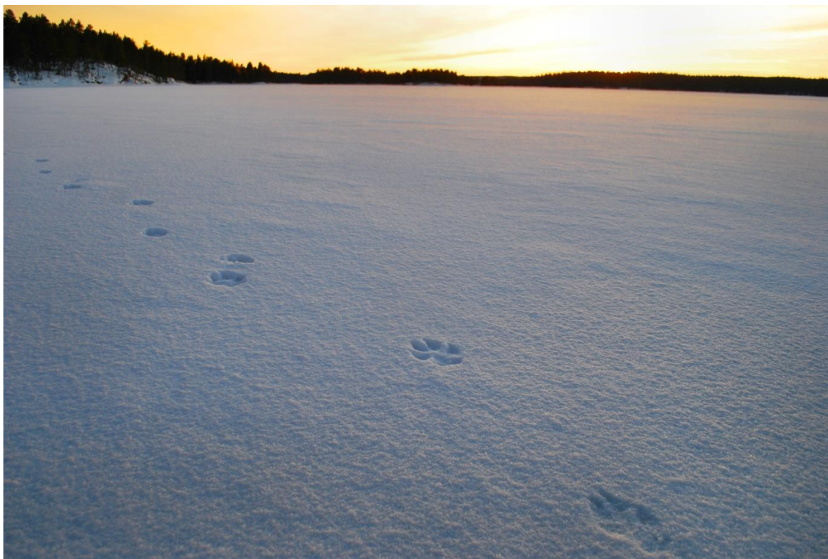
Vargspår på Stora Gla

Var rädd om naturen, det finns bara en. Styrelsen