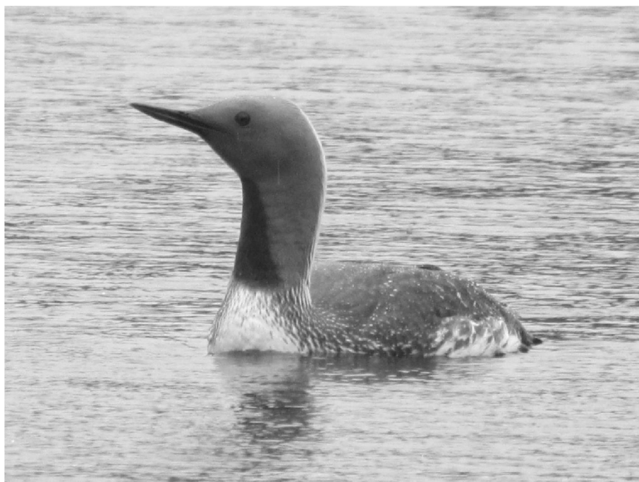
Smålom i tjärn på södra Glaskogen.