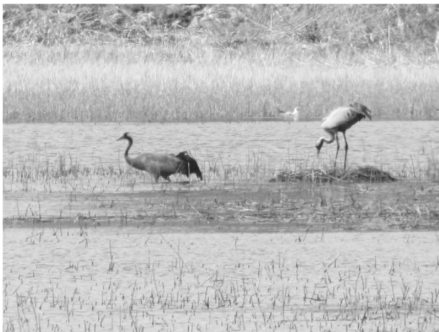
Tranor vid bobale på strandängen.

Reservatet är också värt att besöka på våren för fågellivet. I hassellunden är fågelsången intensiv vid denna tid och på strandängen rastar olika fåglar tillsammans med de som ska stanna kvar och bygga bo, bl.a. alla skrattmåsar. Det kommer ofta rovfåglar på besök, både fiskgjuse, brun kärrhök och havsörn. Rördrommen tutar ofta i vassbältena.