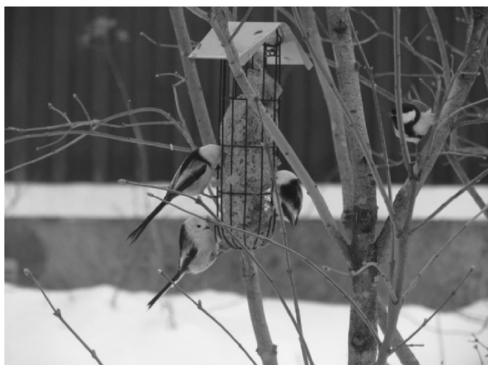
Stjærtmesar vid fågelmatning

Vägbeskrivning: från Arvika kör väg 61 mot Karlstad ca 10 km, ta till vänster mot Byn (ca 1,4 km efter Furtakorset), efter 500 m finns skylt till fågeltornet och parkering vid vägkanten. Kontaktperson: Göran Carlzon, 0570-550 56